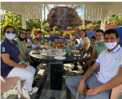
Kids Days Octobre 2020