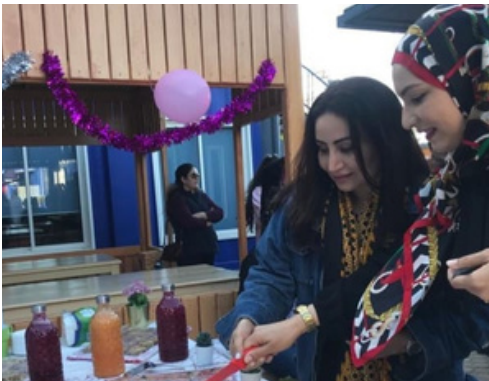
Promotion interne Février 2020