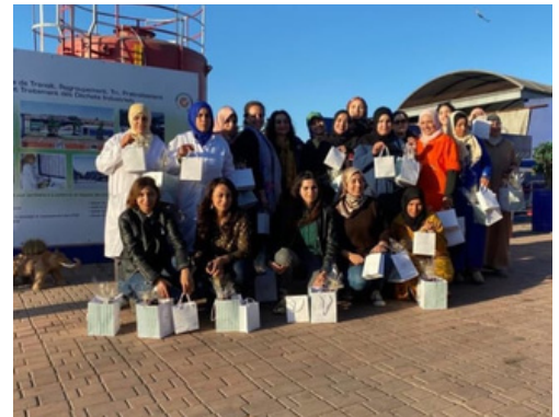
Journée de la femme 8 Mars 2020