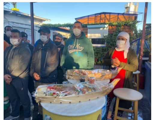
Fête de fin d'année 31 Décembre 2020