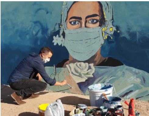
Activité artistiques Septembre 2020